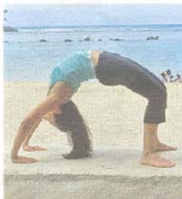
«Das Rad»: Weihnachts-Alternative.